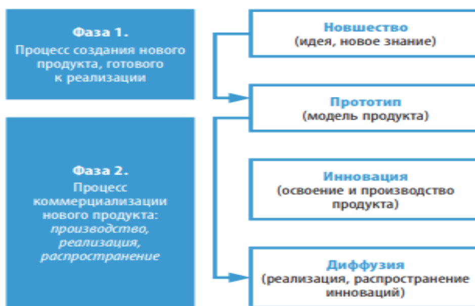
Рис. 1. Обобщенное представление фаз инновационного процесса

Обобщенно указанные стадии можно свести к двум фазам инновационного процесса, приведенным на рисунке 1.